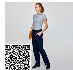
DAILY WOMAN PA9118