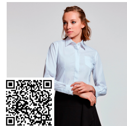
SOFIA L/S CM5161