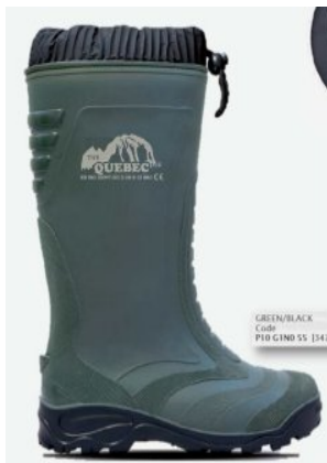
verde/negru Cod: P10 G1No 55[347]