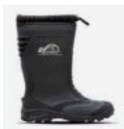
negru/negru P10 NONO SS[347]